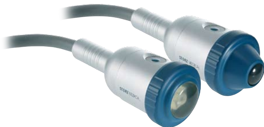
STORZ MEDICAL цилиндрический источник

Эти особенности делают ДУОЛИТ® SD1 мощным инструментом, который способствует технологическому прогрессу медицины.