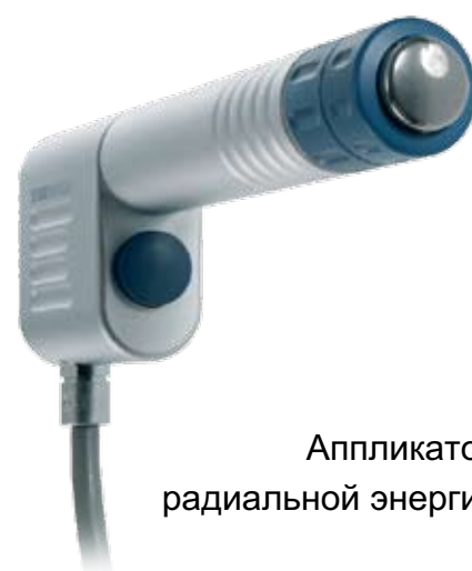
Аппликатор радиальной энергии